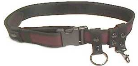
Fajilla de Lona(no incluye aditamentos)