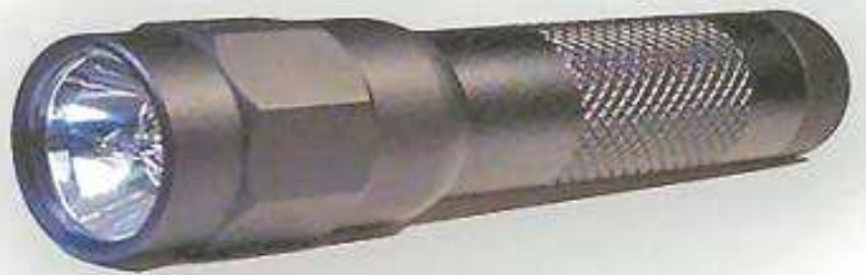
Lampara Recargable , con led Creed.