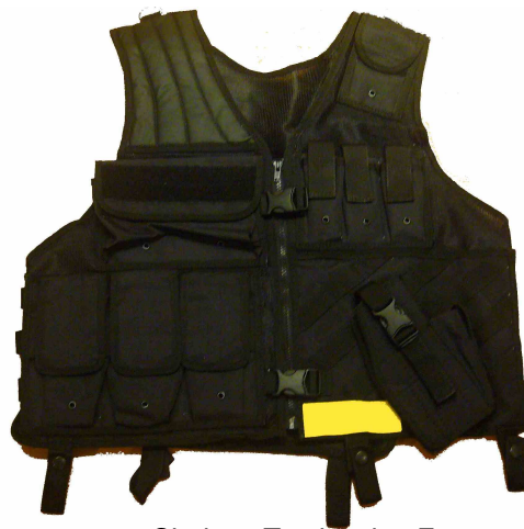
Chaleco Tactico tipo E Talla normal