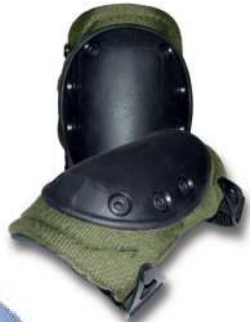
Rodillera verde solido modelo y APRINSA50410-09