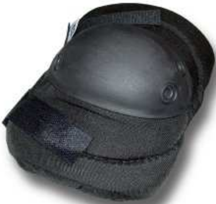
Codera negra modelo APRINSA53010