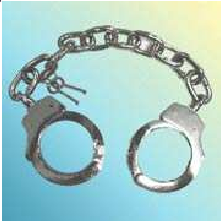
Esposas de Pies modelo 202 , Tamaño Extragrande, En terminado Niquel Satinado. Peso Aproximado de 1,kg. Esposas ABAP