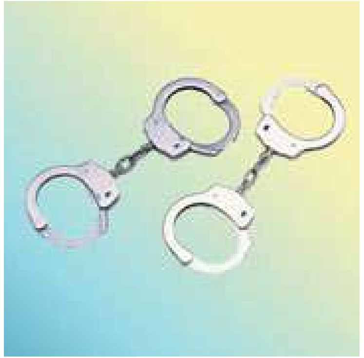
Esposas modelo 101 de Acero Inoxidable, con 20 dientes de seguridad, seguro sencillo. Peso de 265 gramos. Esposas ABAP