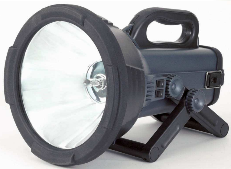
Lampara SPOT15 de Halogeno tipo Spot de 15 millones de Candelas , recargable y portátil