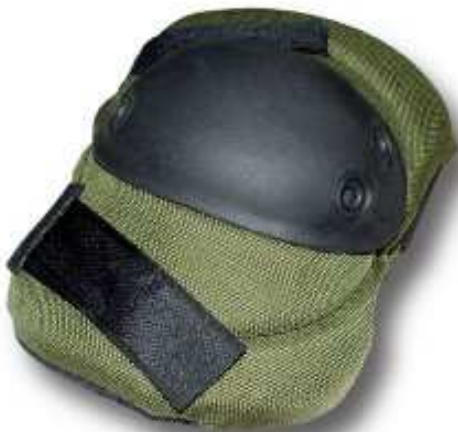
Codera verde modelo APRINSA53010-09