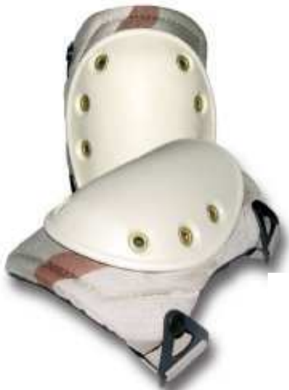
Rodillera camuflageada modelo APRINSA50410-12