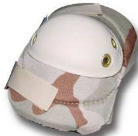
Codera camuflageada modelo APRINSA53010-12