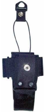
Porta Radio Universal