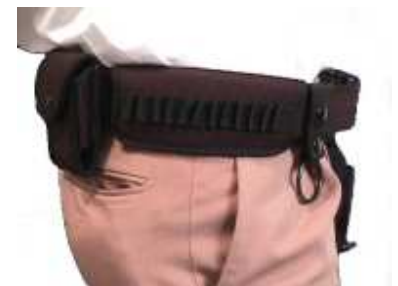
Fornitura completa 8 piezas :fajilla, cartuchera, porta gas, porta pistola , porta esposas, porta llaves, porta tolete, funda