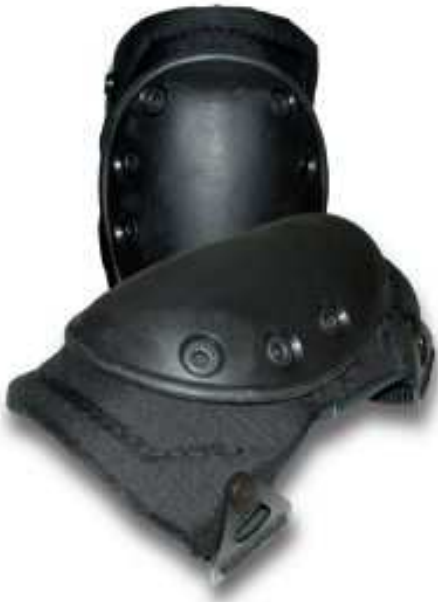
Rodillera negra modelo APRINSA50410