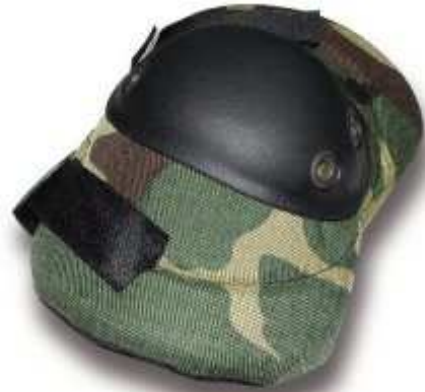
Codera Camuflageada modelo APRINSA53010 – 08