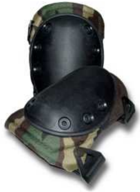
Rodillera verde camuflageado modelo APRINSA50410-08